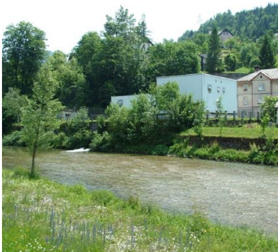
Slika 1: Strojnična zgradba