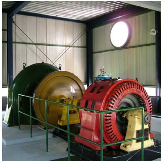
Slika 2: Notranjost strojnične zgradbe