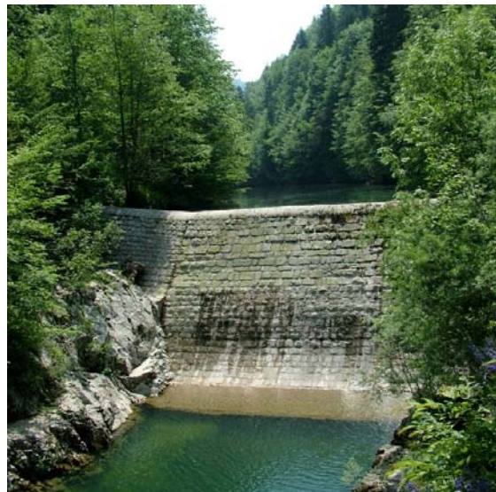
Slika 4: Pregrada