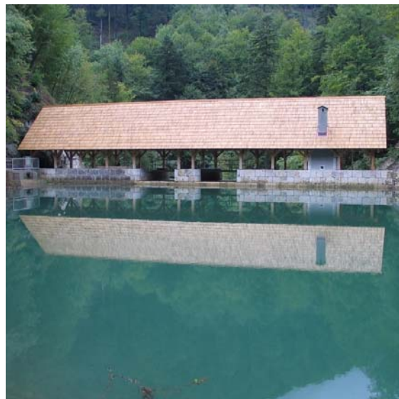
Slika 2: Kanomeljske klavže (dolvodno)