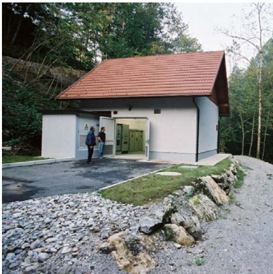
Slika 1: Strojnična zgradba